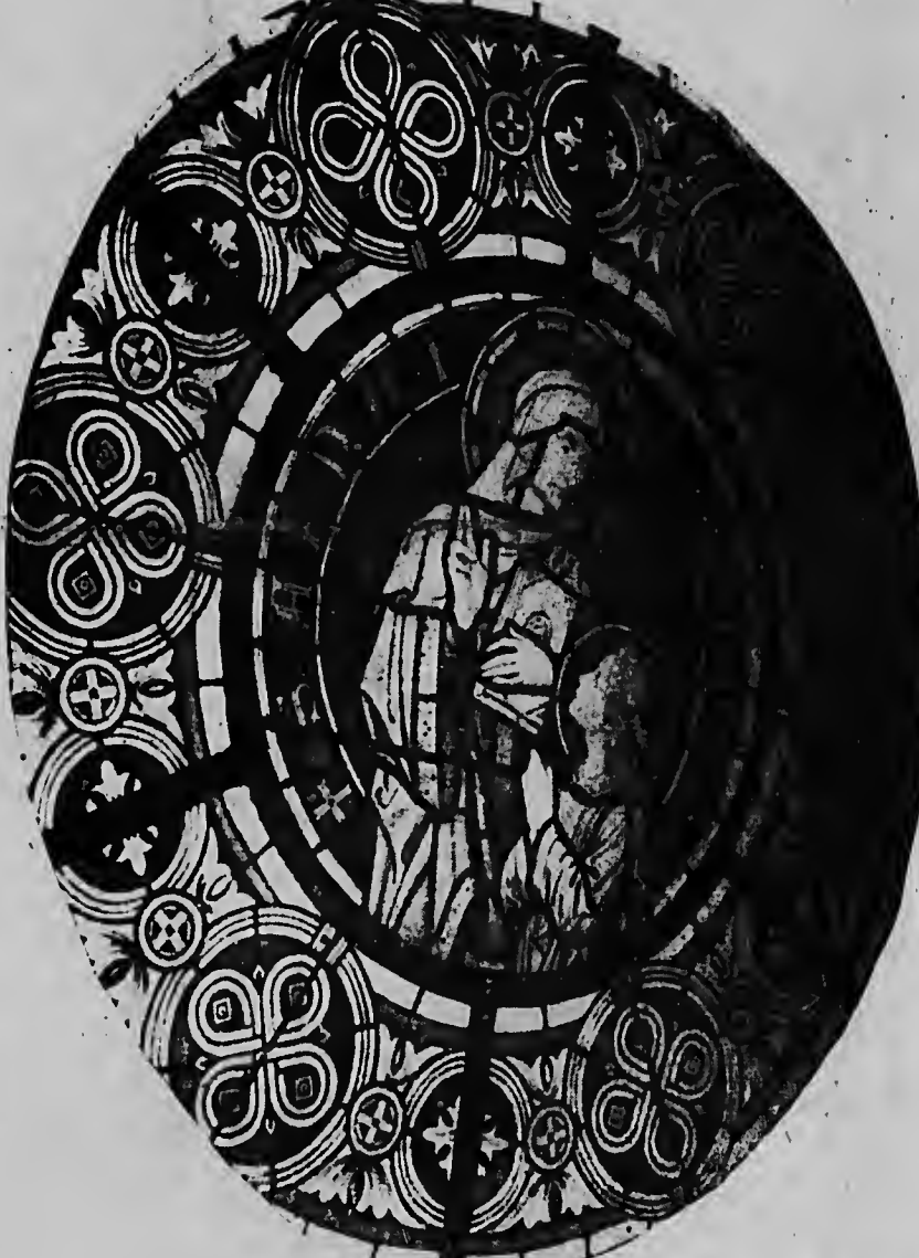
Dit is een fragment uit het grandchilderde raam van de R.K. Kerk op de Noord. De Heilige Anna, Moeder van de H. Maagd Maria, en de Heilige Maagd staan in het midden van het raam. Vijf en twintig jaar geleden werd dit raam in Kevelaar in Duitsland gemaakt en de narochariënen van de Noord hebben dit raam aan de kerk geschonken. Dit fragment vertegenwoordigt ons aller gedachte op de Kerstdagen, wanneer wij immers de geboorte van Christus herdenken.

De Lions daar hebben zich toen in de States over het meisje ontfemerd en gezorgd dat het haar aan niets ontbrak.